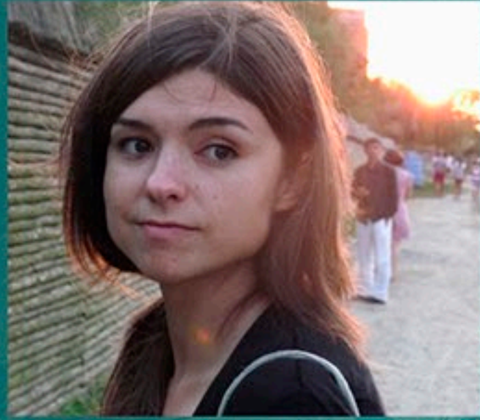
IMÁGENES – MAIALEN SARASUA

Licenciada en Comunicación Audiovisual por la Universidad Pompeu Fabra de Barcelona, su actividad se ha desarrollado sobre todo en el campo del montaje tanto en cine como en televisión. Ha editado entre otros, los largometrajes de ficción Bajo la Piel de Lobo y Amaren Eskuak , y los documentales El Último Paso y Ventanas al Interior . En un plano más personal, ha escrito y dirigido 4 proyectos, entre los que destacan los cortometrajes Donde Nunca Pasa Nada y Hemen Nago . En televisión estuvo a cargo de la realización del programa literario Sautrela de ETB1.